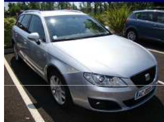
EXEO ST 2.0 TDI 143 GranVia