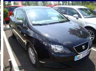
IBIZA SC 1.4 TDI REFERENCE