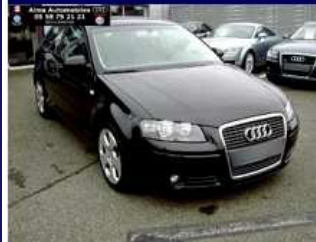
AUDI A3 2.0 TDI140 Ambition