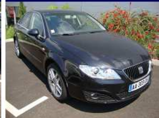
EXEO 2.0 TDI 143ch STYLE