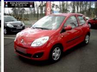
TWINGO 1.2 16v Authentique