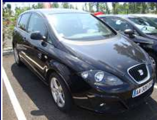
ALTEA 1.9 TDI 105 TECHSIDE