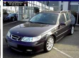
SAAB 9-5 3.0 TID VECTOR