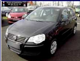
POLO 1.4 TDI 70 5p