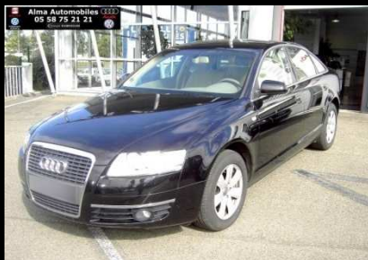
A6 quattro 2.7 TDI180 Ambiente Tiptronic