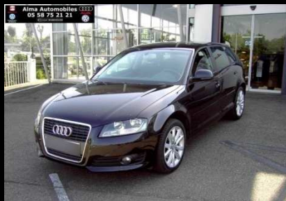
A3 Sportback 2.0 TDI140 DPF Ambiente