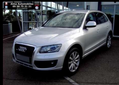
Q5 2.0 TDI DPF Avus