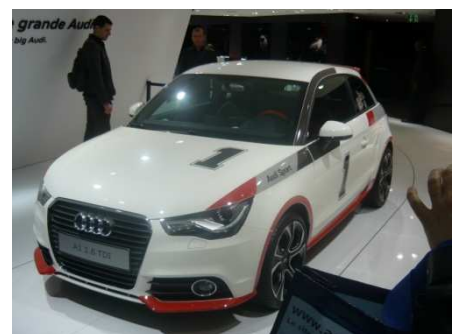
A1 1.6 TDI Sport

« Toutes les valeurs d'Audi dans moins de quatre mètres » : c'est ainsi que la marque aux anneaux présente son nouveau bébé. Marque automobile préférée des Français, devenue la première de la catégorie premium, Audi n'a, semble-t-il, qu'à décliner ses fondamentaux à travers les différents segments du marché pour connaître le succès.