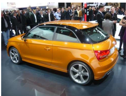
A1 1.4 Exclusive