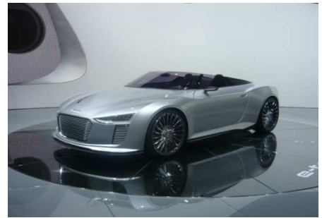
Concept Car e-tron spider