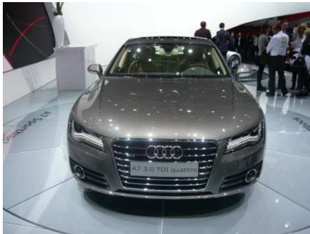
Nouvelle A7 3.0 TDI quattro