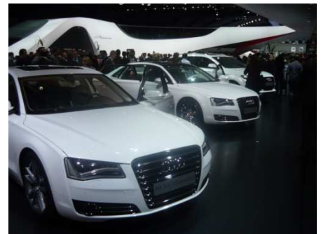
A8 3.0 TDI quattro