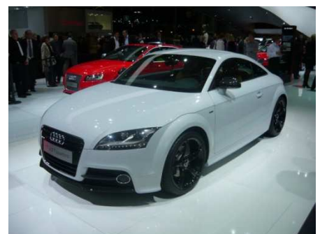
TT 2.0 quattro