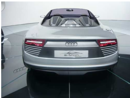
Concept Car e-tron spider

A découvrir chez ALMA Automobiles à partir du 29 Octobre 2010.