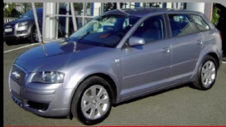
A3 2.0 TDI 140 Ambiente