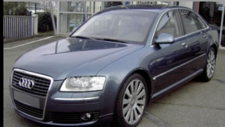
A8 Quattro 4.2 TDI326 Avus