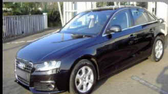
A4 2.0 TDI 143 Ambiente