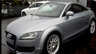
TT Quattro 2.0 TDI170 DPF S-Line