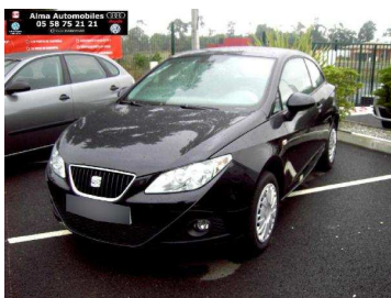
Ibiza SC 1.6 TDI90 FAP Style 3p 31 899 kms 02/06/2010 13 290 Euro TTC