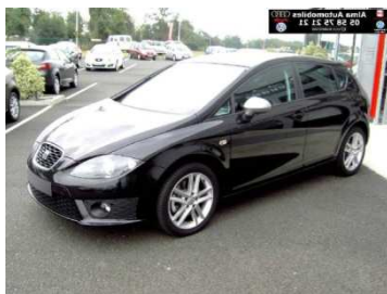
Leon 2.0 TDI170 CR FAP FR 16 798 kms 10/06/2010 20 490 Euro TTC