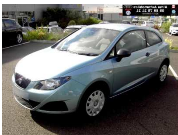
Ibiza SC 1.4 TDI FAP Reference 3p 27 087 kms 24/07/2010 11 490 Euro TTC