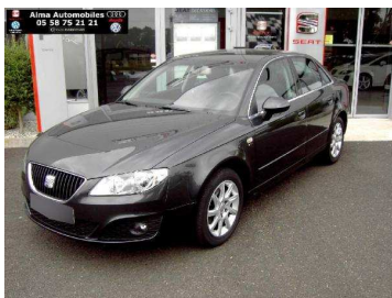
Exeo 2.0 TDI143 CR FAP Style 23 752 kms 01/06/2010 19 990 Euro TTC