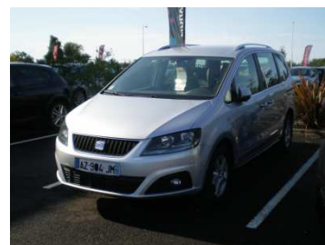
Alhambra TDI 140 Style 6 000 kms 02/09/2010 34 100 Euro TTC