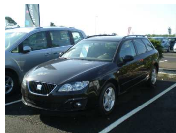
Exeo ST TDI CR 120 Intuition 11 kms 27/01/2011 22 900 Euro TTC