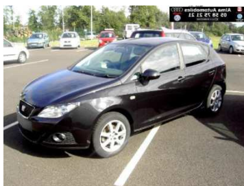
Ibiza 1.6 TDI90 FAP Style 5p 35 708 kms 01/06/2010 13 290 Euro TTC