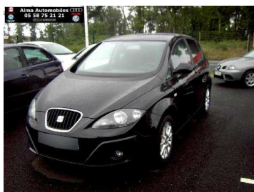
Altea 1.9 TDi105 Style 25 735 kms 02/06/2010 17 990 Euro TTC