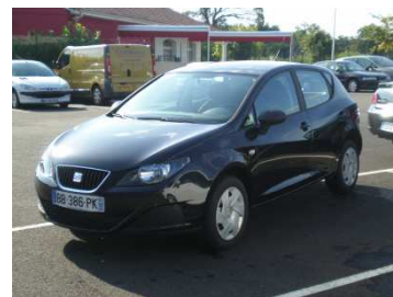
Ibiza 1,2 TDI CR 75CH Reference 16 000 kms 14/10/2010 12 490 Euro TTC