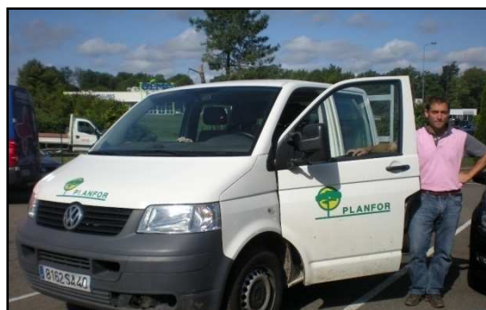
Transporter Volkswagen VU

Rémi LUQUET : Nous avons 25 véhicules qui se répartissent en 6 tracteurs forestiers, 5 camions disposant d'un plateau, 8 véhicules utilitaires et 6 véhicules de tourisme. Récemment nous venons de commander un nouveau Transporter Volkswagen car le précédent donne entière satisfaction. C'est le seul capable de cumuler les fonctions 4x4 avec une double cabine et disposant d'un plateau, le tout sans aucune concurrence en matière de prix.