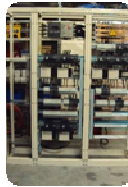
Armoire de câblage montée par SDP