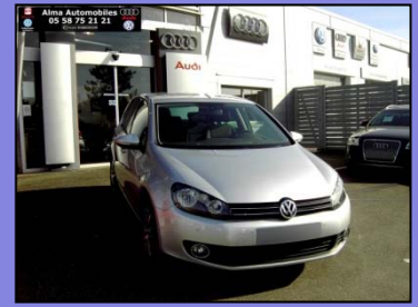
VW Golf 1.6 TDI105 FAP Confortline 5p 22 257 kms 11/03/2010 19 790 Euro TTC