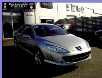
PEUGEOT 407 Coupé 2,0 HdI Sport FAP 32 590 kms 18/12/2008 18 990 Euro TTC