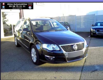
VW Passat SW 2.0 TDI110 Confortline 39 495 kms 23/12/2009 20 490 Euro TTC