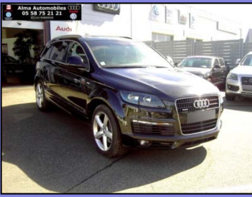
AUDI Q7 4,2 TDI DPF S Line Tipt 5pl 76 342 kms 27/06/2007 45 990 Euro TTC