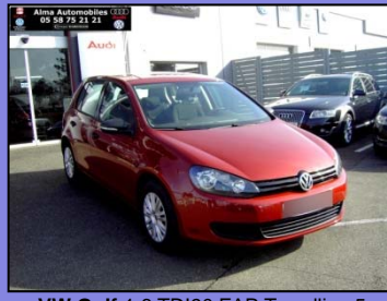
VW Golf 1.6 TDI90 FAP Trendline 5p 34 462 kms 05/01/2010 15 990 Euro TTC