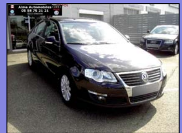
VW Passat 2,0 TDI110 CR FAP Confortline 30 984 kms 20/10/2009 18 990 Euro TTC