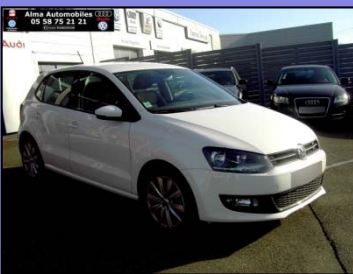
VW Polo 1.6 TDI90 FAP Sportline 5P 32 463 kms 09/04/2010 15 990 Euro TTC