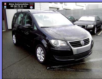
VW Touran 1.9 TDI105 FAP Confortline 30 058 kms 23/12/2009 20 490 Euro TTC