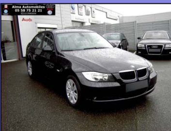
BMW Série 3 320d Confort 5p 69 263 kms 10/09/2007 19 790 Euro TTC