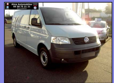
VW Transporter Fg Long TDI130 Cft 119 956 kms 07/12/2007 14 990 Euro TTC