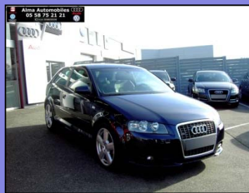
AUDI A3 2.0 TDI140 S Line 3p 76 774 kms 24/10/2007 18 490 Euro TTC