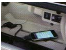
Multimédia & Navigation

Pour profiter encore plus de votre véhicule et l'adapter parfaitement à vos envies et à votre image, découvrez chez votre concessionnaire ALMA Automobiles la gamme d'accessoires Volkswagen.