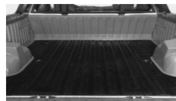
Protection latérale Protège les 4 parois 340 € (1)

Des questions ? Appelez le 05 58 75 07 07