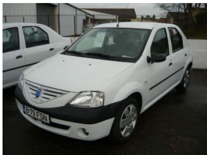
LOGAN 1.4 MPI Lauréate 64 699 KMS 06/03/2008 5 190 €