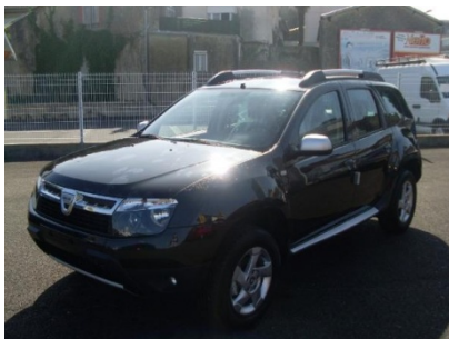
DUSTER dCi 110 4x4 Lauréate 10 KMS 01/06/2011 20 300 €