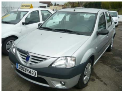
LOGAN 1.5 dCi 70 Lauréate 81 329 KMS 26/03/2008 6 800 €