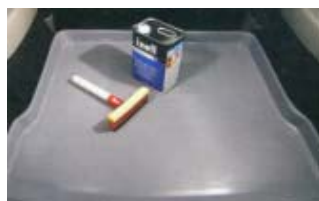
Bac de coffre simple transport divers objets 75 € (1)