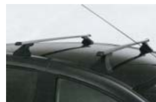
Barres de toit transversales poids maxi 80 kg 75 € (1)