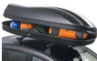
Coffre de toit Carver 4,5 pour 75 kg de bagages 249 € (1)