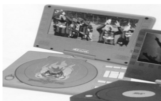
Lecteur DVD Div 91 R Hauts parleurs intégrés 169 € (1)