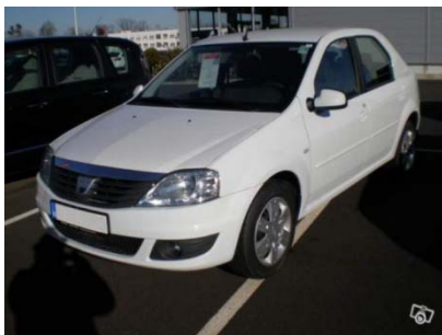
LOGAN 1.4 MPI Lauréate 46 800 KMS 01/06/2008 6 290 €