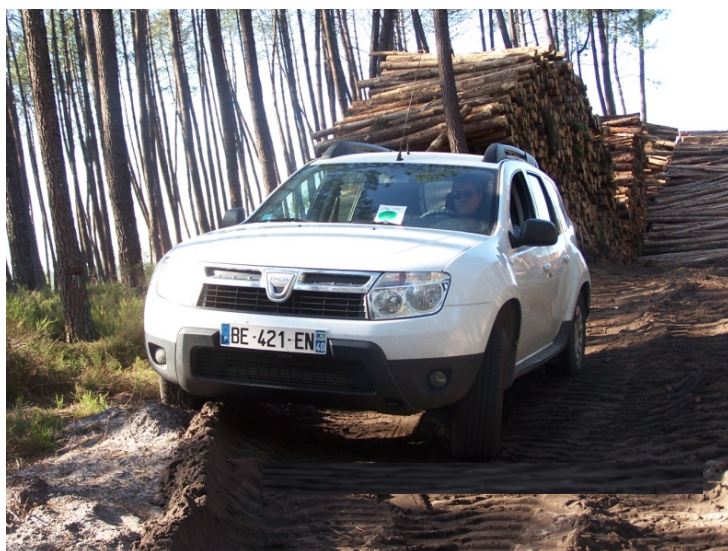
DACIA Duster Lauréate dCi 110 4x2, dans les chemins forestiers des Landes

FL : Oui, nous nous sommes engagés depuis longtemps dans les certifications. Nous sommes certifiés PEFC, norme défendant la forêt européenne et justifiant de la traçabilité du bois. Ensuite, nous sommes ISO 14001 qui est la norme environnementale. On est vraiment engagé dans cette politique. Le fait d'avoir mis en place des process de cette norme nous a par exemple ouvert les marchés anglais (marché de traverses de chemin de fer). Nous portons beaucoup d'attention aux émissions de CO 2 et par conséquent au choix de nos véhicules.