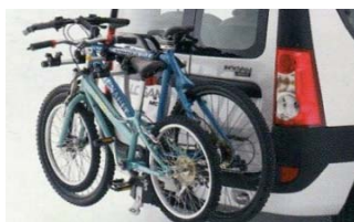
Attelage col-de-cygne poids maxi 1 300 kg 300 € (1)

D'un très bon rapport qualité / prix, retrouvez les chez nos deux concessionnaires Dacia à Mont de Marsan et à Dax.