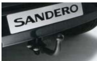
Attelage col-de-cygne Poids tractable maxi 1300 kg 340 € (1)