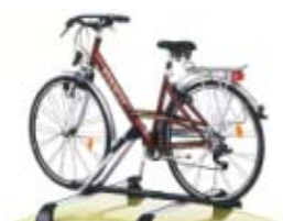
Porte-Vélos sur barre Touring Line 65 39 € (1)