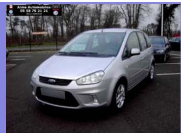
C-MAX 1.6 TDCi90 Trend 42 490 kms 06/10/2009 15 490 Euro TTC