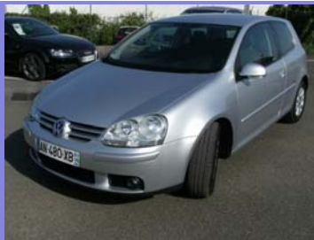
Golf 1.9 TDI90 United 3p 69 515 kms 06/06/2008 11 990 Euro TTC