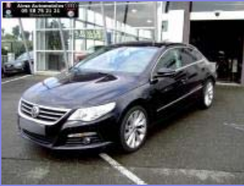
Passat CC 2.0 16S TDI140 CR FAP 20 003 kms 01/09/2010 35 990 Euro TTC