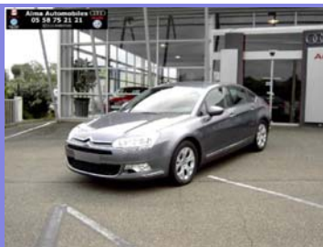
C5 II 2.0 HDI140 FAP Confort 14 666 kms 21/06/2010 22 690 Euro TTC