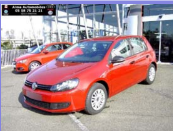
Golf 1.6 TDI90 FAP Trendline 5p 34 462 kms 05/01/2010 15 990 Euro TTC