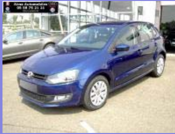
Polo 1.6 TDI75 FAP Confortline 5p 14 124 kms 06/05/2010 14 990 Euro TTC