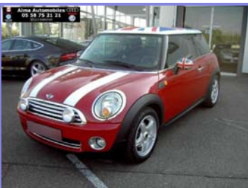
Mini Cooper Pack Chili 50 762 kms 12/01/2007 13 490 Euro TTC