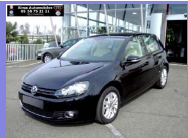
Golf 2.0 TDI140 FAP Carat 5p 28 186 kms 19/06/2009 22 990 Euro TTC