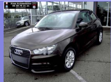
A1 1.6 TDI 105 AMBIENTE 1 666 kms 13/11/2011 20 490 Euro TTC