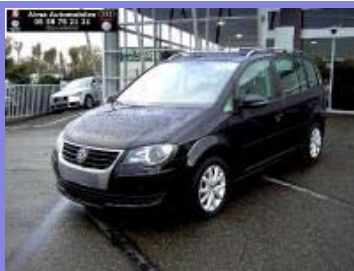
Touran 1.9 TDI105 FAP Confortline 30 058 kms 23/12/2009 20 490 Euro TTC