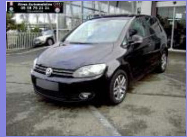
Golf Plus 1.6 TDI105 FAP Confortline 32 639 kms 23/03/2010 18 990 Euro TTC