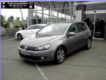
Golf 1.6 TDI105 FAP Confortline 5p 16 126 kms 05/06/2010 19 990 Euro TTC